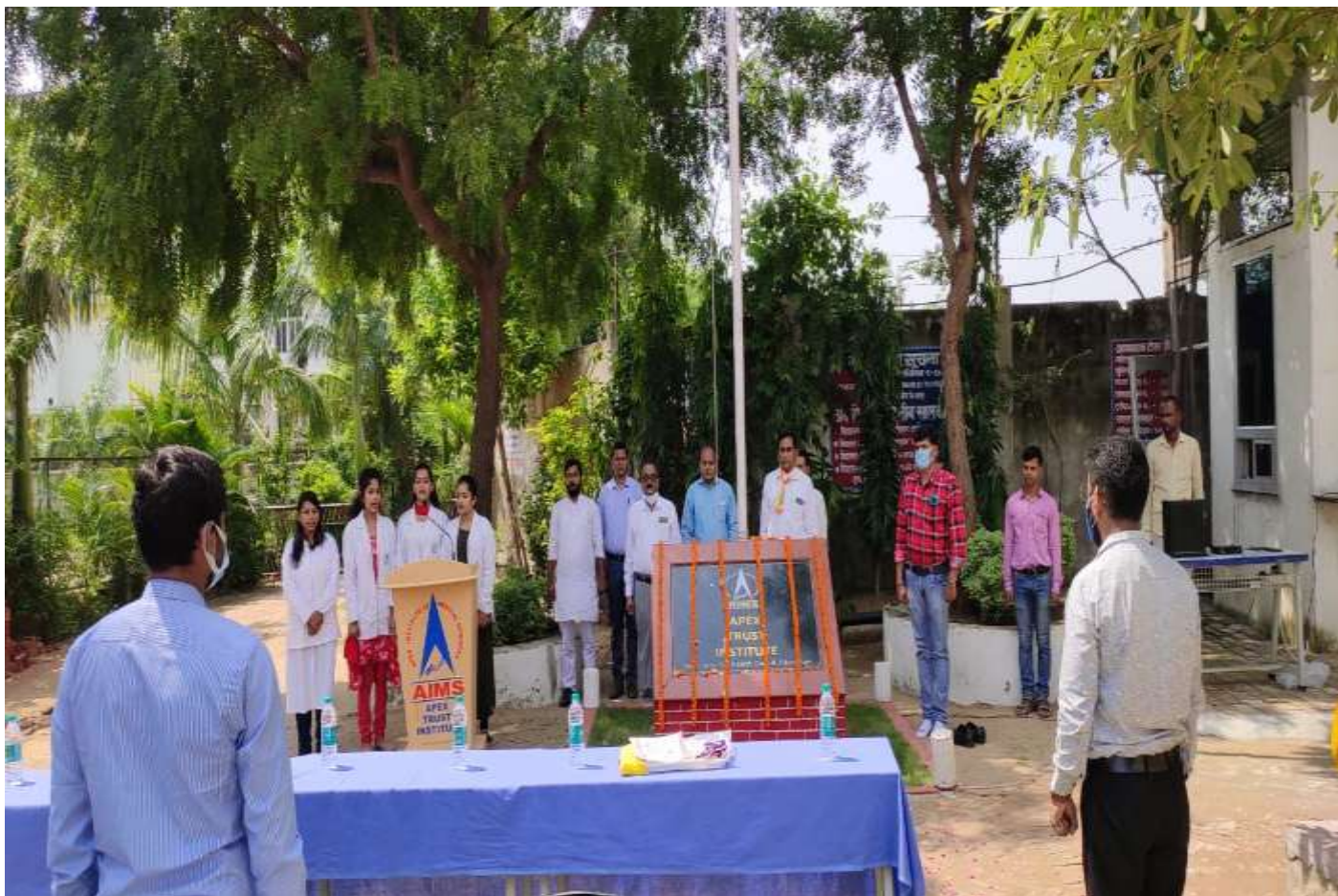
After the Flag Hosting National Anthem by all Staff & Students