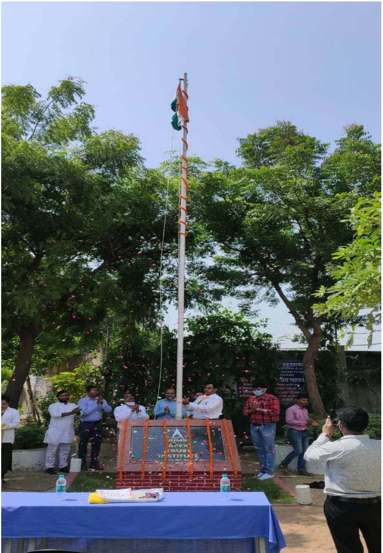
Flag Hosting by Hon'ble Chairman Sir