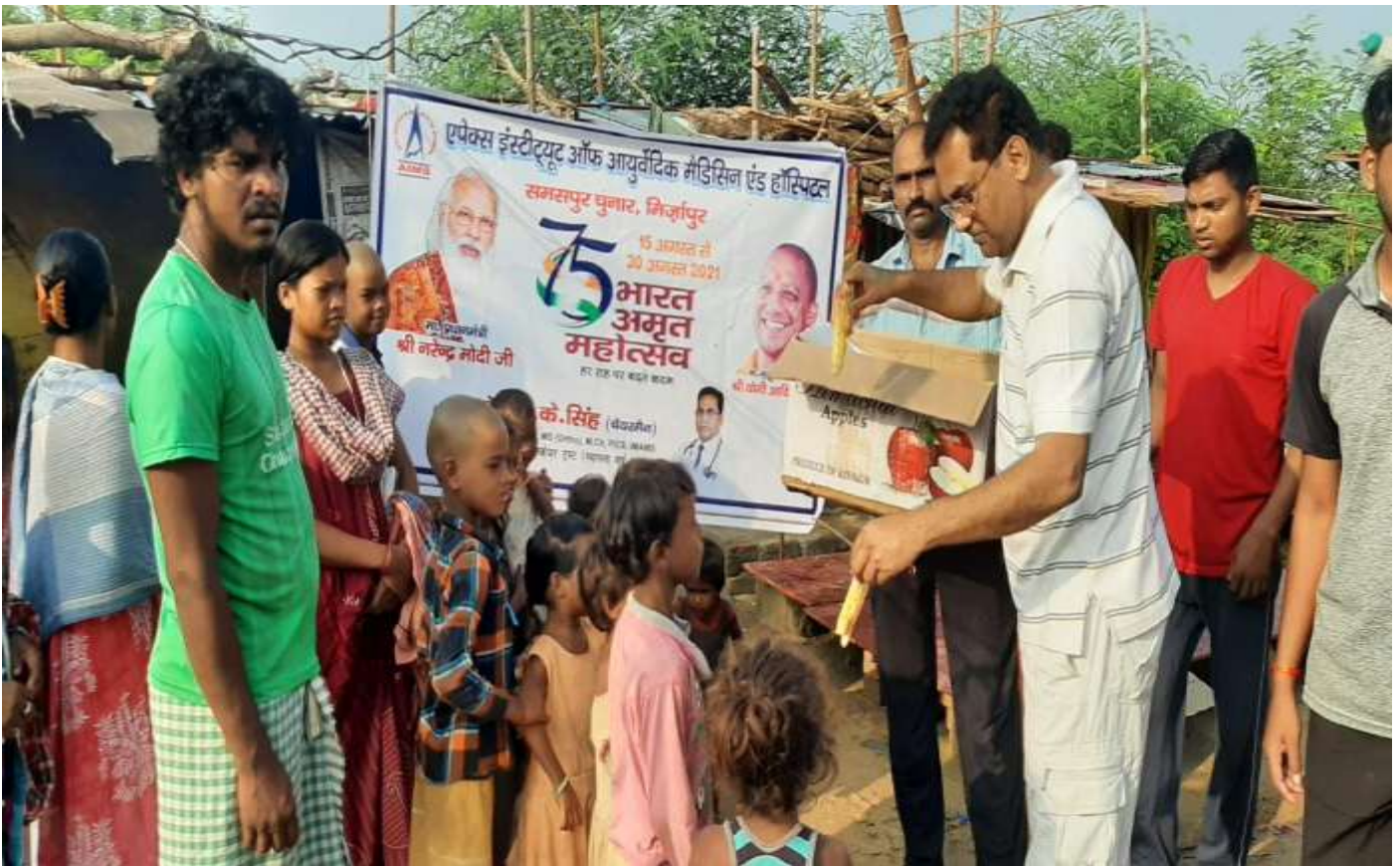
Distribution of Food to Children by Hon'ble Chairman Sir