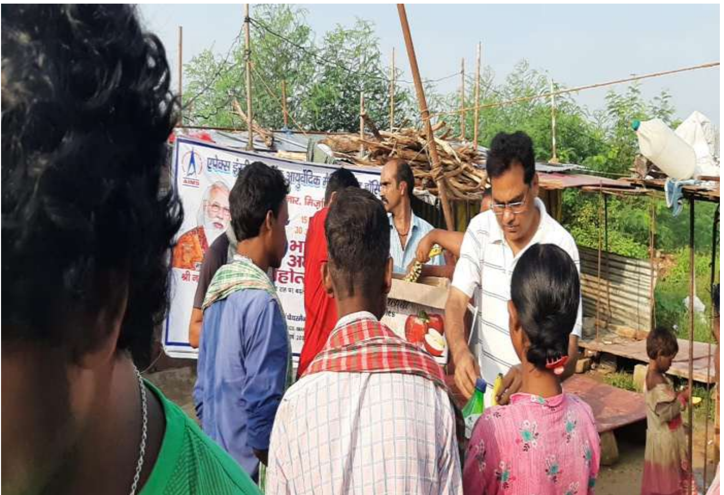
Distribution of Food to Children by Hon'ble Chairman Sir